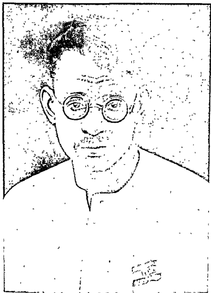
श्री गणेश शंकर विद्यार्थी